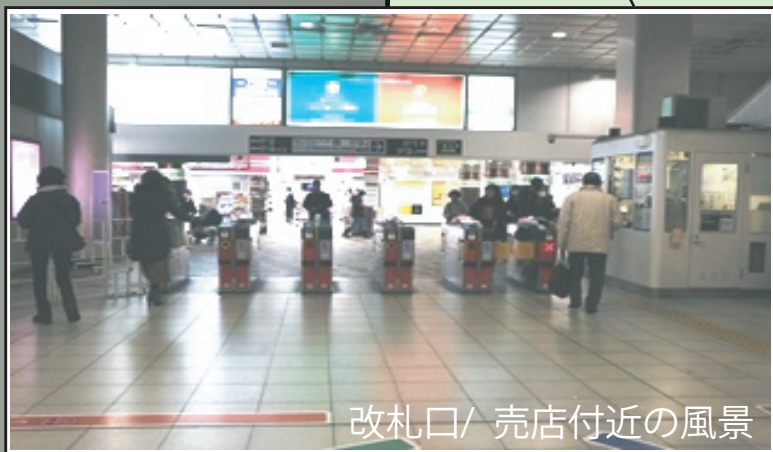
改札口/ 売店付近の風景