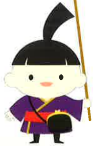
Official mascot character of Omotenashi Concierge Kyomaru

We open information center at Mielparque Kyoto 1F. 新的观光案内所在梅尔帕尔克大楼落成了