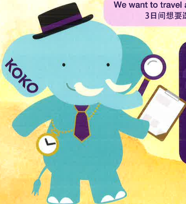
Official mascot character of 京 KOKO Omotenasu Zoukun (a big bro)

We want to eat something Kyoto-like. 想吃京都当地才有的美食!