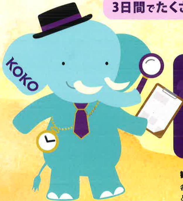
京 KOKO マスコットキャラクター おもてなすゾクくん(兄)